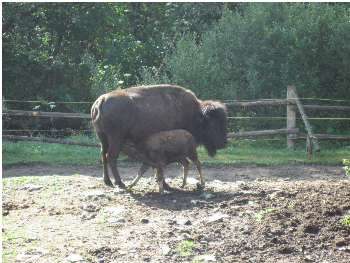
Bizoní výběh navazuje na ojedinělou botanickou zahradu v Prášilech.