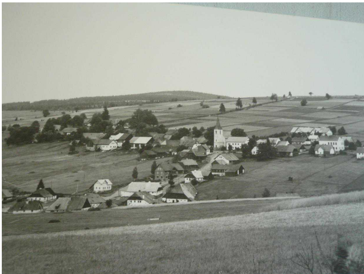
Srovnávací fotodokumentace Zhůří z roku 1938 a stejné lokality likvidované obce v roce 1995 dokládá ztrátu krajinného rázu, pohody, pocitu důvěrnosti a bezpečnosti v krajině bezlesí.