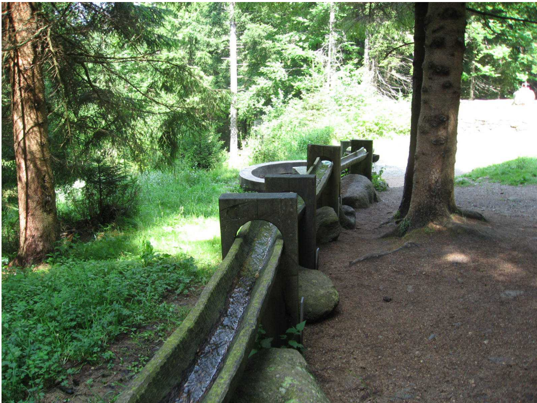
Výtvarně pojatý přívod vody u torza Hauswaldské kaple vytváří asociaci ztracených pramenů v krajině.