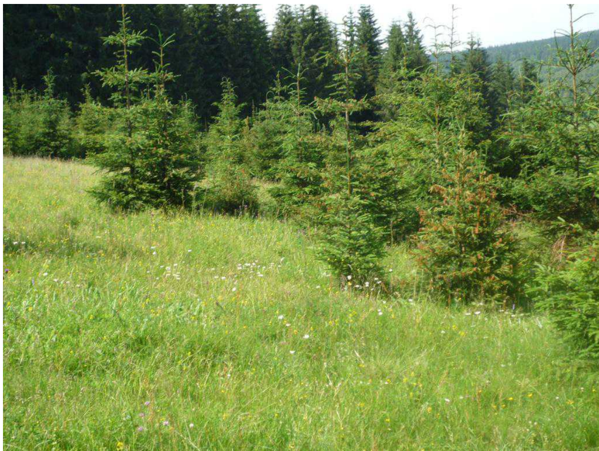
Iniciační stádium náletu do neobhospodařované louky – Zhůří Arnika ustupující agresivnímu koberci semenáčů na louce – Zhůří