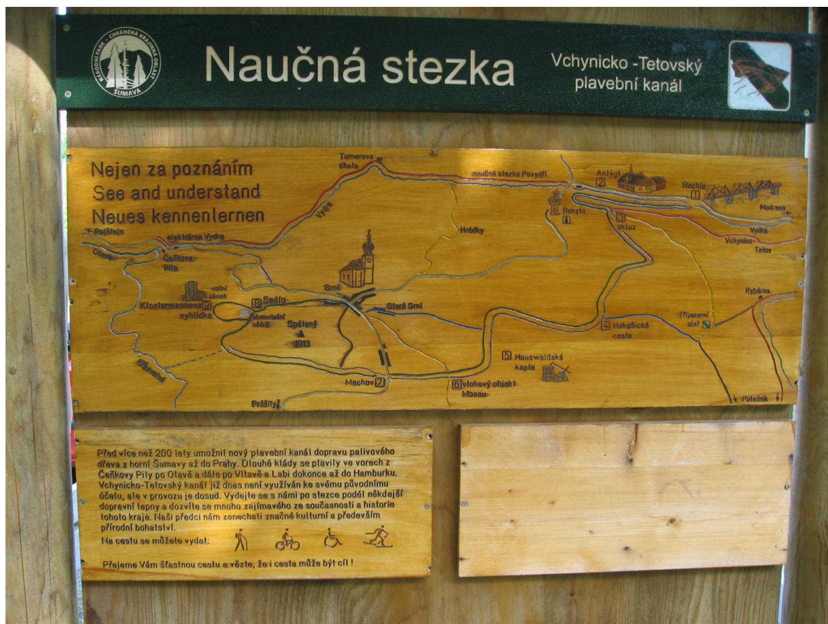
Vchynicko-tetovský kanál nebyl na štěstí zasypan, takže po obnově slouží jako vynikající turistická atrakтивita.