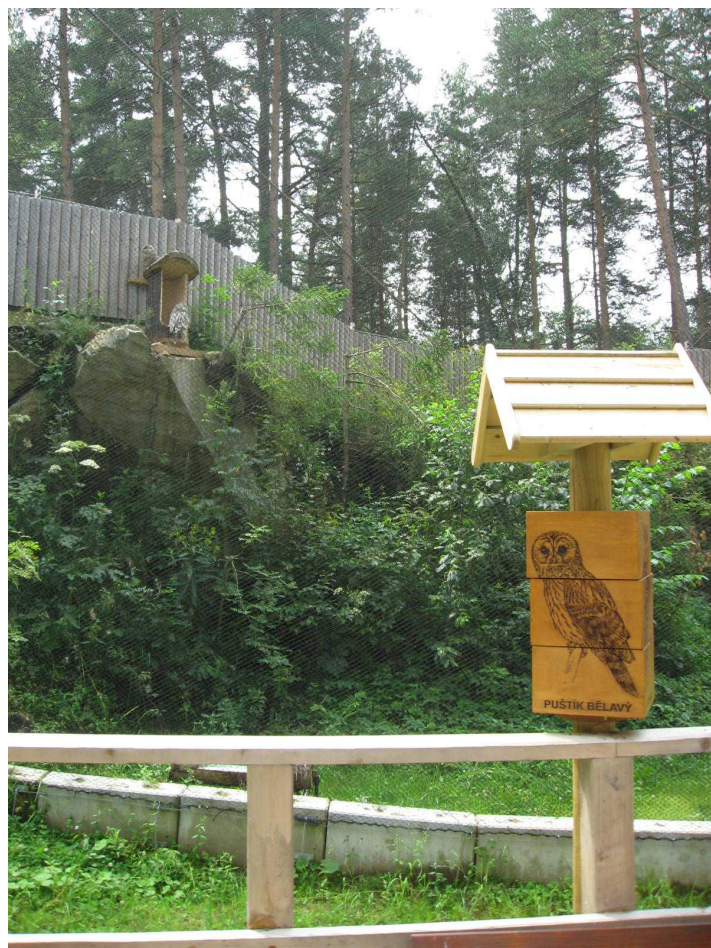
Jednou z mála živých expozič jsou soví voliéry v Borových Ladech.